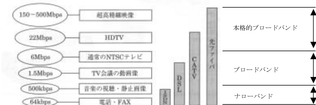
図表11 各種コンテンツごとに要求される回線容量とアクセス回線の関係